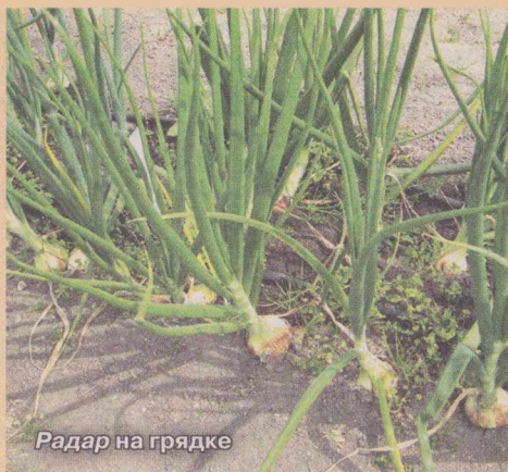
Радар на грядке

осенью и развивается дольше, поэтому она более мощная и лучше обеспечивает растение влагой и питанием, соответственно, будет выше урожай.