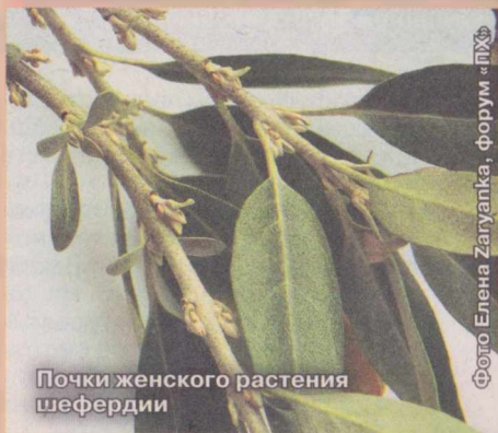
Почки женского растения шефердии

Дальневосточный государственный университет Дальневосточный институт биологии и экологии Дальневосточный институт биологии и экологии Дальневосточный институт биологии и экологии Дальневосточный институт биологии и экологии Дальневосточный институт биологии и экологии