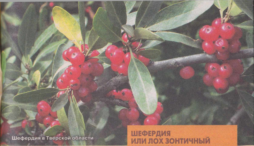
Шефердия в Тверской области

повышают эластичность и прочность стенок кровеносных сосудов. Так что ягоды шефердии очень полезны всем, у кого проблемы с сосудами.