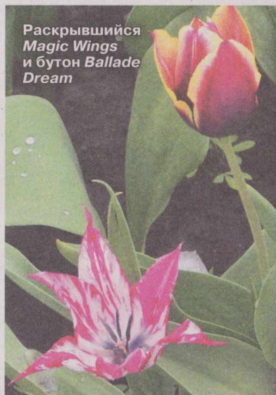
Раскрывшийся Magic Wings и бутон Ballade Dream