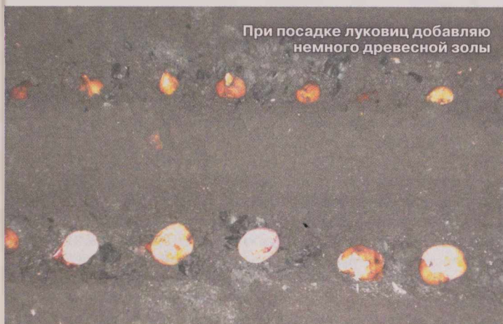
При посадке луковиц добавляю немного древесной золы

Не секрет, что для здорового развития и цветения тюльпанам нужны хорошо освещенные участки. Но и у та-