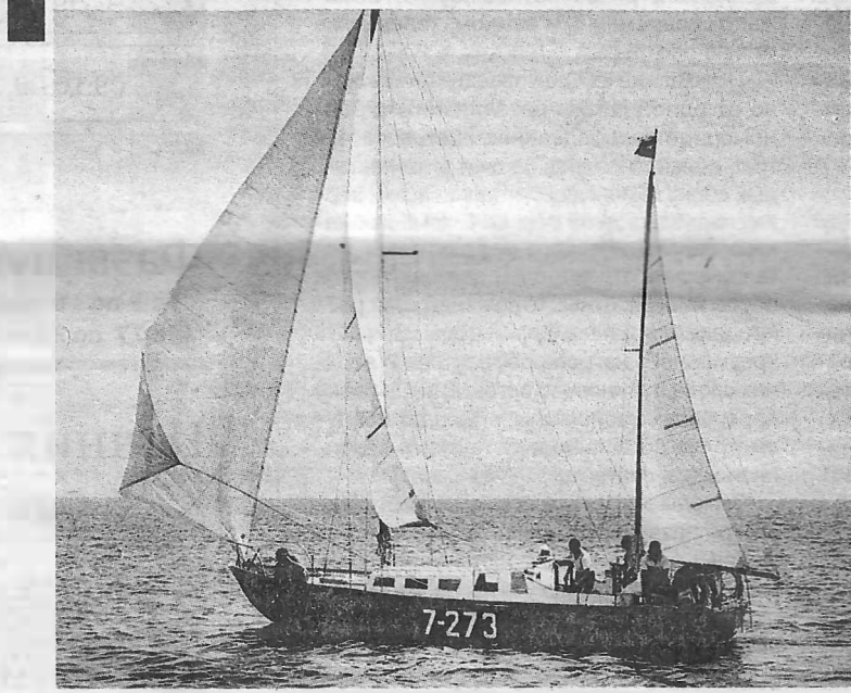
В молодости автор книги часто ходил под парусами

В 1956-м вышел фильм «В мире безмолвия» легендарного изобретателя акваланга и исследователя океанов Жака-Ива Кусто. А чуть позже появилась книга Ольги Жуковой «Подводная охота»: