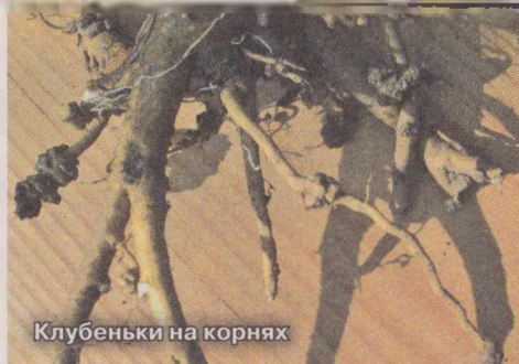
Клубеньки на корнях

Б обы - отличный предшественник для любых овощей и цветов, а также зеленое удобрение. Они оздоравливают почву и обогащают ее азотом.