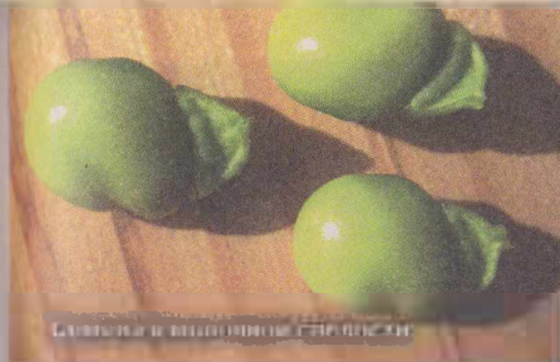
Сладкая и зеленая фасоль