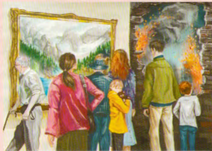
Слияние Вселенных Рисунок Анастасии СУХОВОЙ