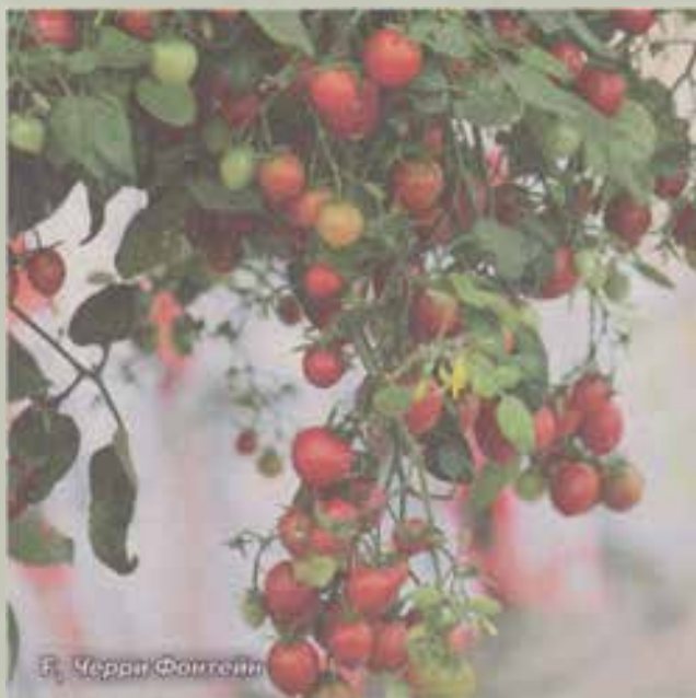
Ф. Черри Фонтан

Д ля ампельных томатов хороши контейнеры из верса. Такие емкости изначально рекомендуют для выращивания картошки, но томатам-каскадам они тоже подходят - высокие и компактные, легкие и мягкие, с дышащими стенками.