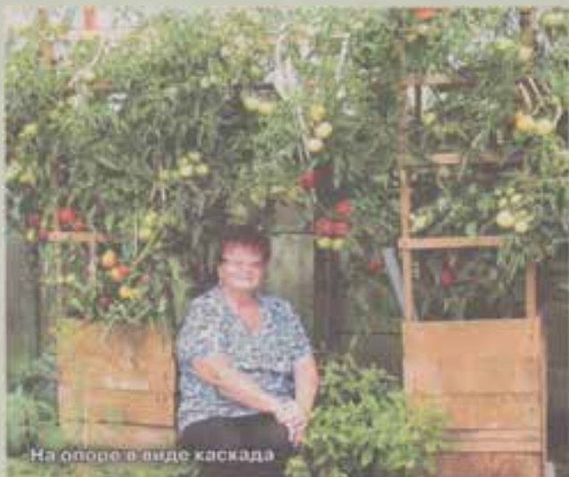
На опоре в виде каскада

F, Пиа Дропс (pear drops - «грушевые леденцы») - достаточный объем горшка 2,5-3 л. Свисающие побеги длиной до 45 см. Плоды созревают через 55 дней после высадки рассады, а от всхо-