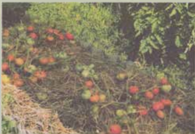
Стелющийся Монгольский карлик