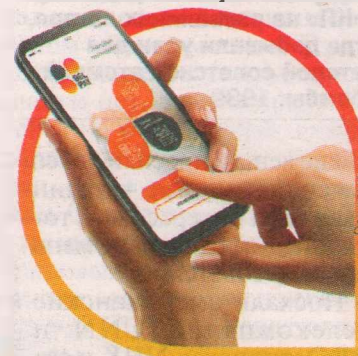
Одно приложение для решения десятков вопросов.

Приложение можно скачать на платформах Google Play, App Store или на сайте белгородэнерго.рф. Отметим, что регистрироваться придется только новичкам - без малого 200 тысячам пользователей «Личного кабинета» сбытовой компании достаточно установить приложение и пройти авторизацию под своим логином и паролем.