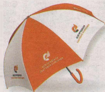
Онлайн-сервисы для потребителей - доступно и комфортно.

К примеру, получение необходимых справок. Как гласит статистика от Белгородэнерго, запрос на получение документа о наличии или отсутствия задолженности за потреблённую электроэнергию составляет