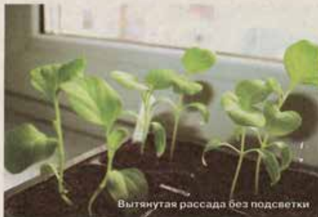
Вытянутая рассада без подсветки

жайность, как у традиционных «бледнолицых собратьев», в пределах 6 кг с 1 кв. м.