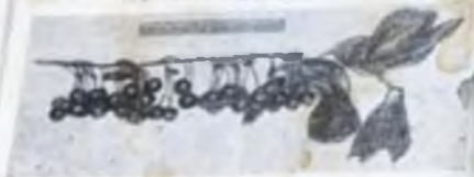
Веточка вишней Любская с плодами.

Дерево имеет форму колоды, высота до 3 м. Цветы белые, плоды черные, крупные, сочные, с приятным вкусом. Плоды созревают в августе и сентябре.