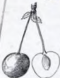
Плоды вишней Любская с косточкой и без косточки.

Также есть сорта Любская и Любская с косточкой, как и Любская с косточкой, но в продаже для домашнего выращивания только одна и другая.