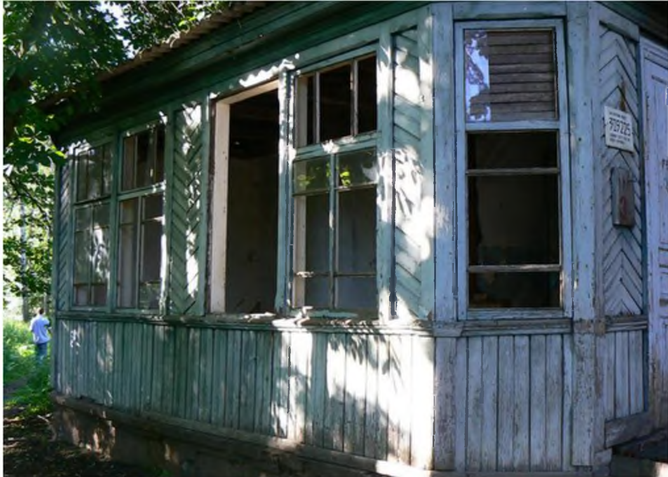
Так усадьба выглядела в 2010 году

В июне 2019-го региональная экологическая общественная организация «Демо-Эко» отчиталась о завершении проекта, на который ранее получала федеральный грант. Суть проекта: благоустройство парков, где растут деревья-патриархи. Школьники и жители посёлка Искра взялись выискивать старейшие деревья возле заброшенного дома, определять их возраст и наводить нехитрую детскую красоту, обустраивая вокруг деревьев мини-клумбы и обсыпая их шишками и опилками.