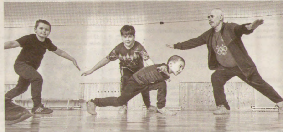
40 минут длится физическая подготовка, потом тактические занятия и игра

не были первыми, но второе место доставалось, и для этого нужно было пахать. С взрослыми футболистами тяжело: как уговорить их прийти на тренировку после тяжёлой работы? Погонять мяч на выходных или поехать на соревнования ещё соглашались.