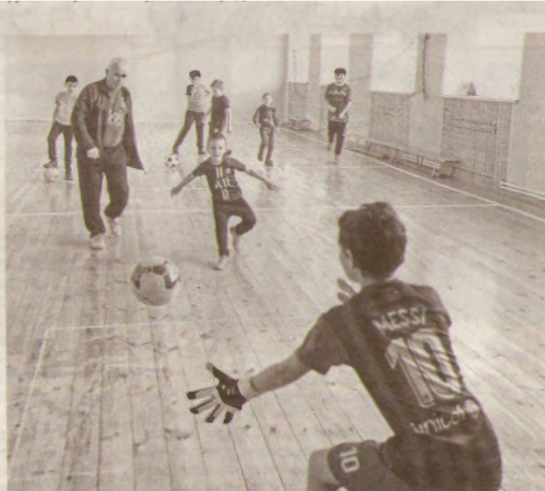
Тренировки проходят три раза в неделю по два-три часа

Футбол помог ему и во время службы в армии в Чите: год он высту-