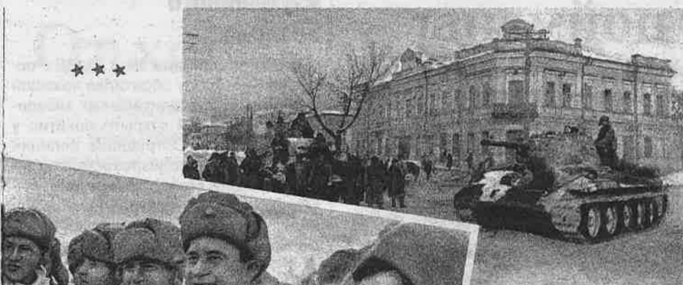
В Белгород вошли части Красной Армии. Норотная передышка — и танки снова пойдут громить врага, гнать его с советской земли.