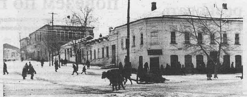
Белгород после первого освобождения. Февраль 1943 года.