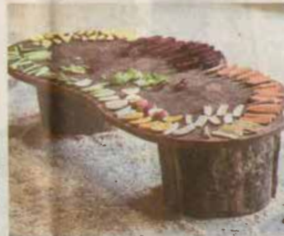
◀ В меню лемуров входят вкусные и питательные блюда