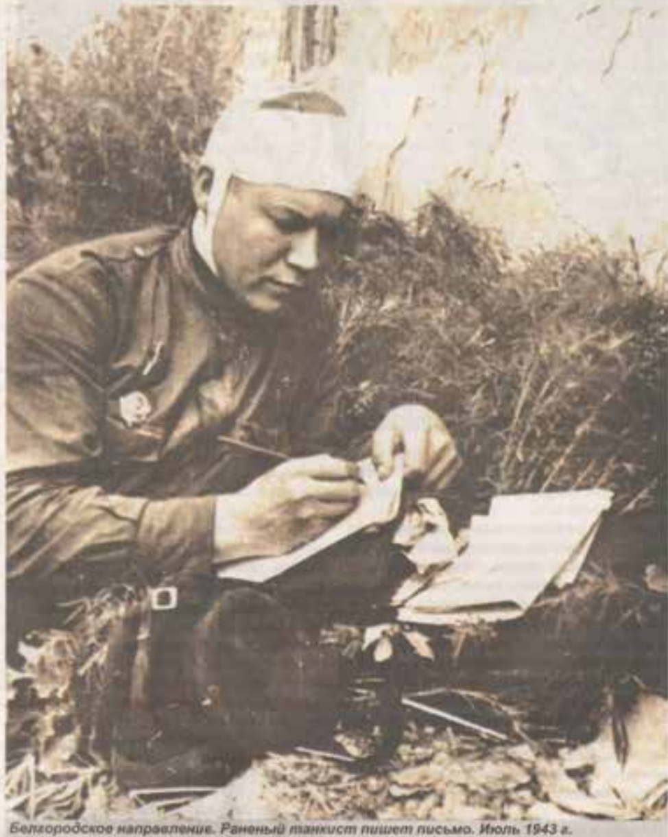
Белгородское направление. Раненый танкист пишет письмо. Июль 1943 г.

В июле 1942 года был направлен на должность заместителя командира по политической части артиллерийского дивизиона 159 гвардейского (в то время крас-