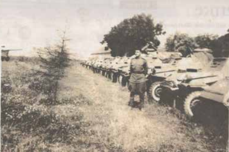
Бронетанковая рота перед Прохоровским сражением, 9 июля 1943 г.

Как всегда, коротко и по существу, как будто Георгий Тимофеевич заполнял журнал боевых действий своего подразделения в далёком 1943 году. Сколькими за этими простыми словами героизма, любви к Родине, человеческого горя, потерь и жажды нашей победы: «...В частях и подразделениях прошли короткие митинги. Солдаты клялись стоять насмерть, уничтожить врага. Все приведено в боевую готовность, проверено до мелочей. Подтянуты тылы. Даны последние указания. Отдан приказ на занятие исходных рубежей...».