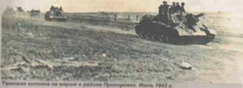
Танковая колонна на марше в районе Протоковки. Июль 1943 г.