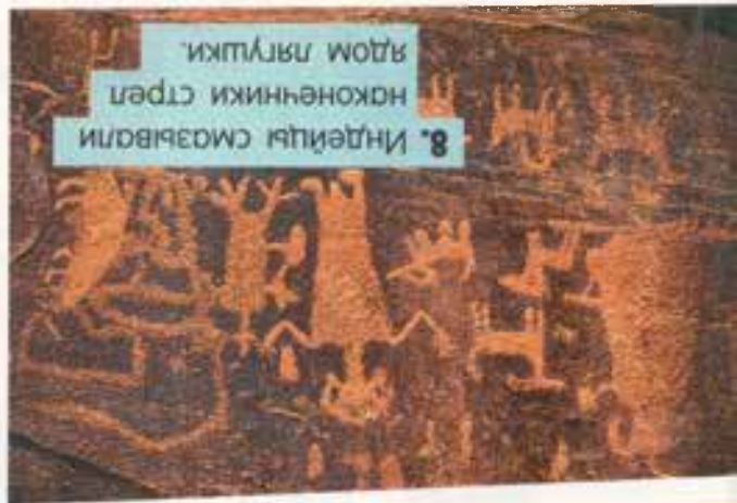
8. Индейцы смазывали наконечники стрел ядом лягушки.