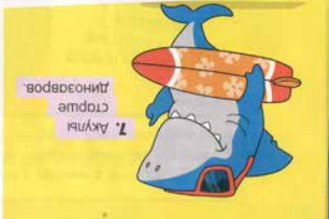
7. Акулы стареют тишегов.