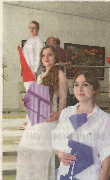
Разноцветные геометрические фигуры ведут нас в мир абстракции

Белгородская правда № 29 (23390) 20 июля 2023 г.