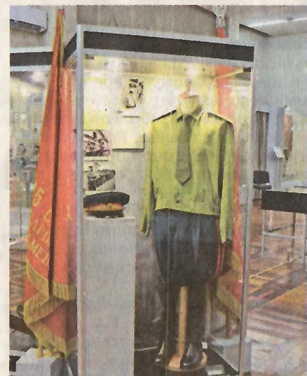
На выставке представлены личные вещи участников битвы