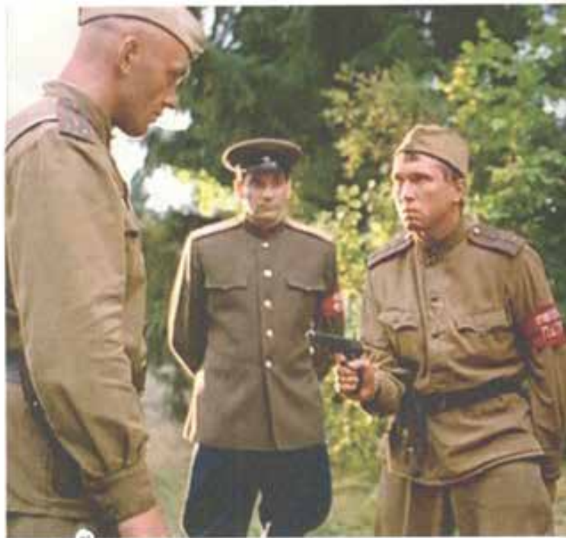
7 Этой операцией «Смерша» восхищались миллионы зрителей. Кадр из фильма «В августе 44-го».

При Абакумове аппарат Министерства государственной безопасности СССР вырос в восемь раз 5 . Любое «распоряжение Министра считалось неопровержимым законом» 6 . Весь военно-политический олимп Советского Союза находился под неуспешным контролем органов. Маршалы и генералы, министры и члены ЦК ВКП(б) — никто не был застрахован от ареста. «Считалось, что если Абакумов принял решение осудить того или иного арестованного, то никакой суд или прокурор, в каком бы со-