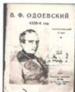
* 16, 17 Фантастический роман В. Ф. Одоевцева «4338 год». Иллюстрация и обложка 1926 года.