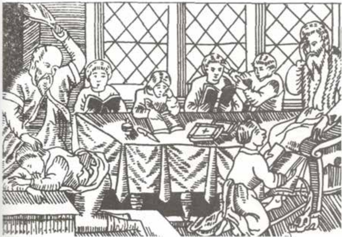
*1 Гравюра из «Азбуковника» Василия Бурцева. 1637 год.