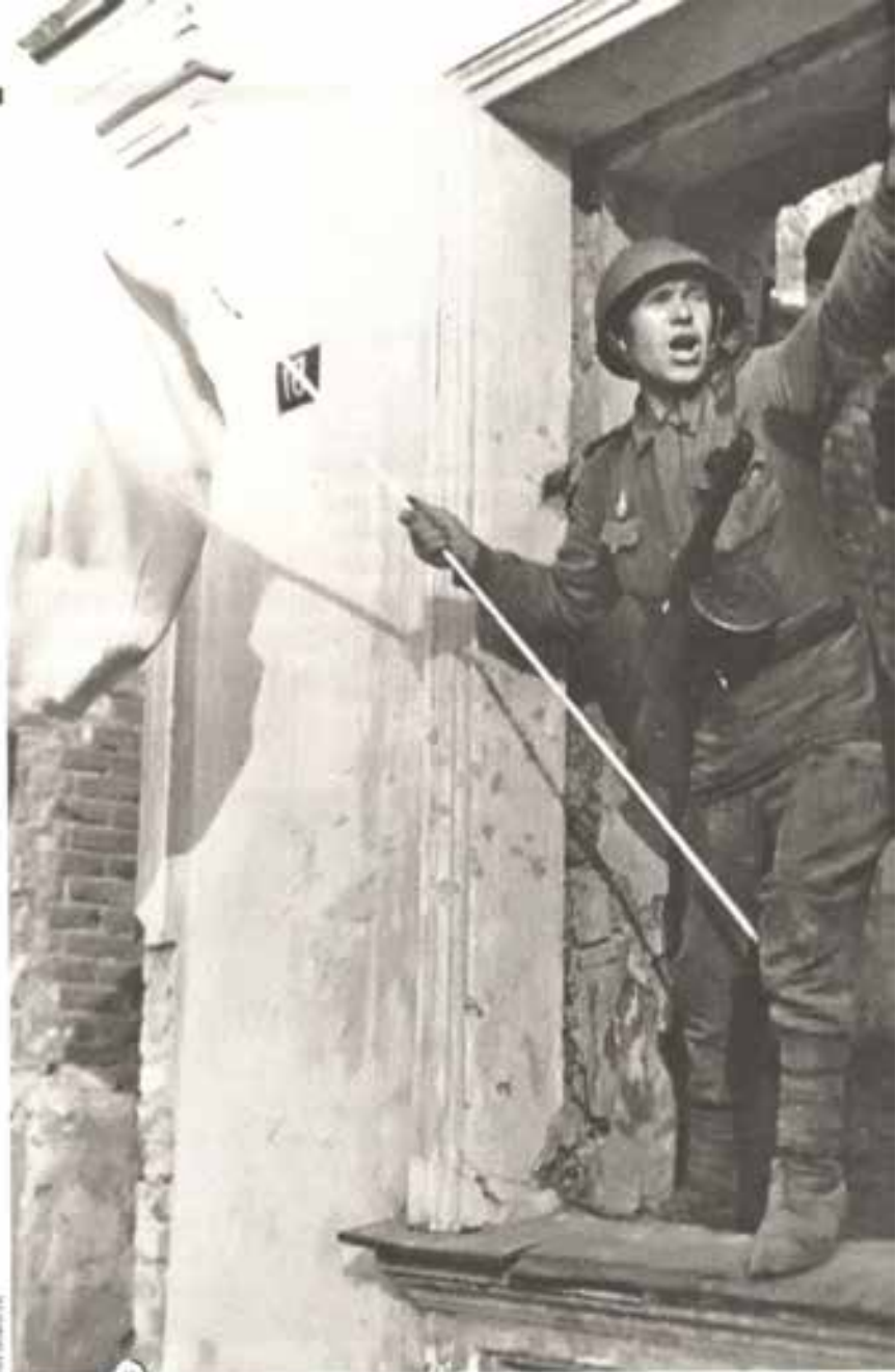
* 14, 15 Орел освобожден.