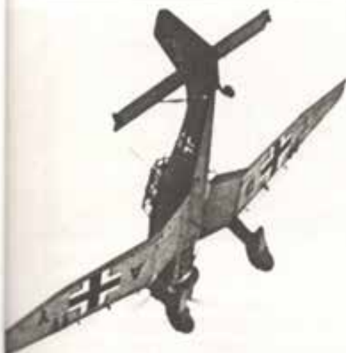
* 10 Внимание, «Юнкерсы»!

АВИАЦИЯ ПРОТИВНИКА С ПРЕОБЛАДАЮЩИМ КОЛИЧЕСТВОМ ШТУРМОВИКОВ ПО-ПРЕЖНЕМУ ВИСИТ В ВОЗДУХЕ БЕЗНАКАЗАННО. СТАРШИЙ ОФИЦЕР ГЕНШТАБА АНДРЕЙ ХАРИТОНОВ