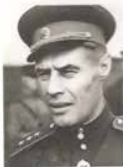
*8 Генерал-полковник Маркиан Попов (1902-1969).

И первым делом бросил против наступающих крупные силы ударной авиации — бомбардировщиков «Юнкерс-88», пикирующих бомбардировщиков «Юнкерс-87Д» и противотанковых штурмовиков «Юнкерс-87Г» и «Хеншель-129».