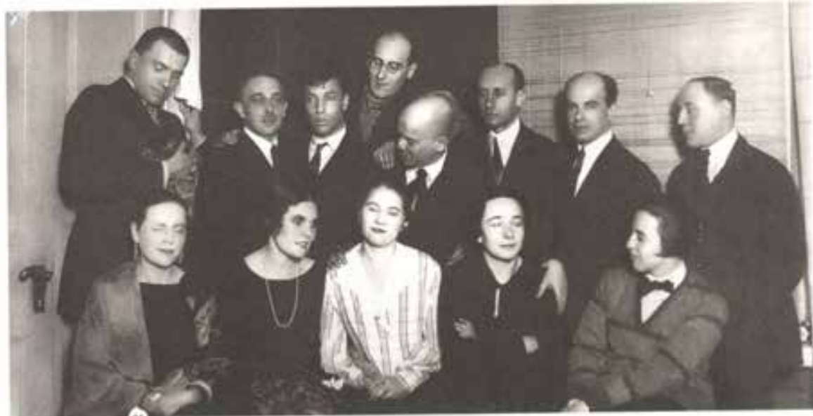
*6 Группа писателей и поэтов: В.В. Маяковский, С.М. Третьяков, В.Б. Шкловский, Б.Л. Пастернак, О.М. Брик, О.В. Третьякова, Л.Ю. Брик. Москва. 1925 год.

нится фрагмент фильма «Закованная фильмой» 1918 года, в котором Маяковский снялся вместе с Лилей Брик. Кроме того, к юбилеям поэта и годовщинам со дня его гибели выходили биографические фильмы (РГАКФД, Арх. № 4014, Арх. № 7967, Арх. № 4050, Арх. № 7445, Арх. № 17223, Арх. № 16828 и другие), Маяковского исследовали как художника (РГАКФД, Арх. № 20260, Арх. № 22575).