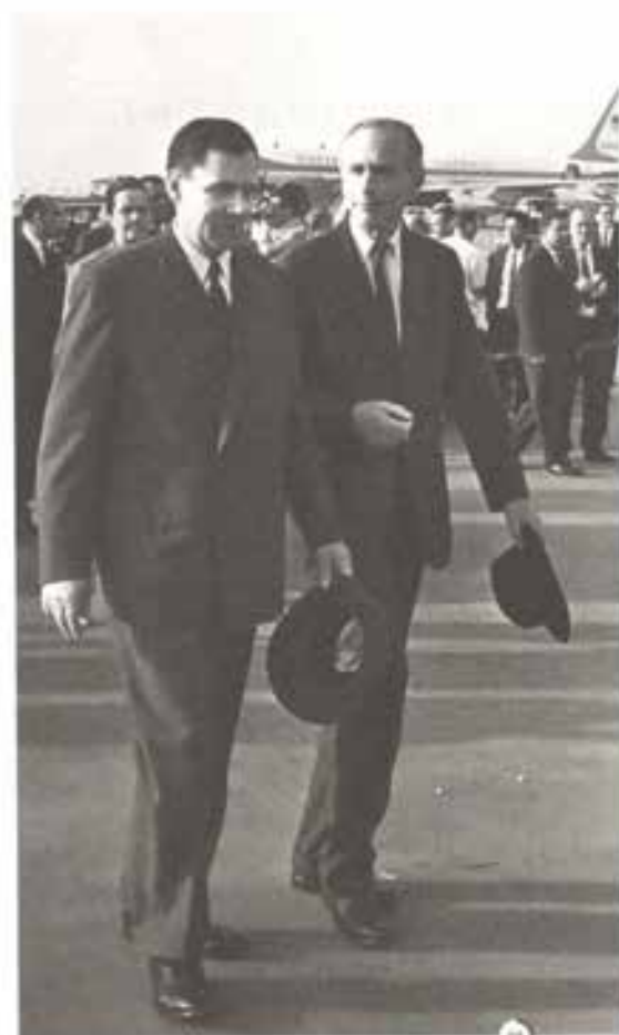
*4 Директивы к переговорам о прекращении испытаний ядерного оружия.