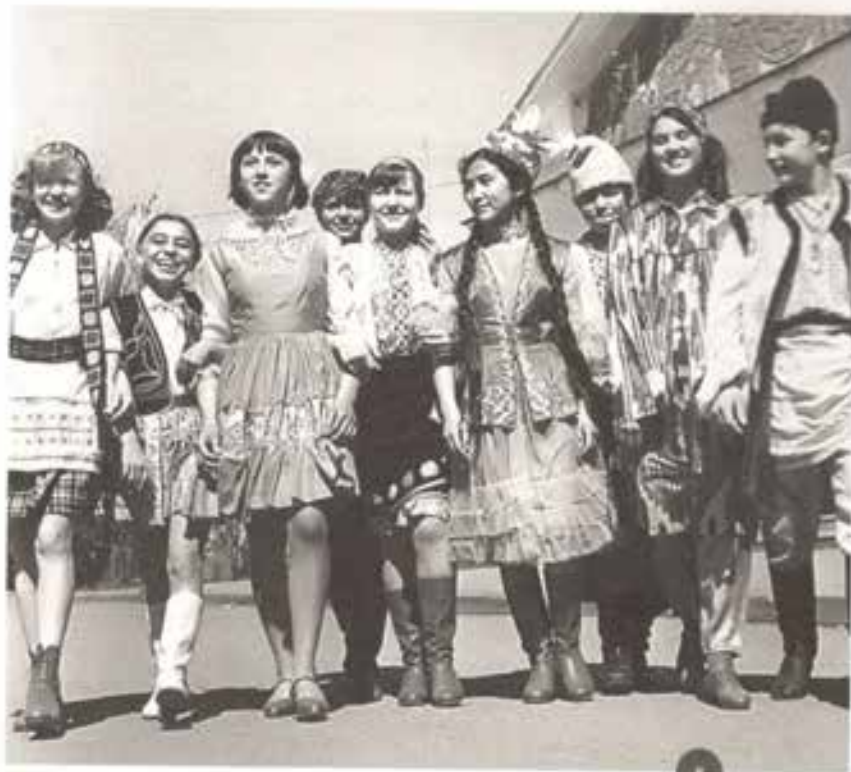
« В Детский ансамбль «Дружба»»

паганда против татар. Нас не прописывают там. А если кто-нибудь из нас поедет туда отдыхать без путевки, его выдворяют оттуда в 24 часа.