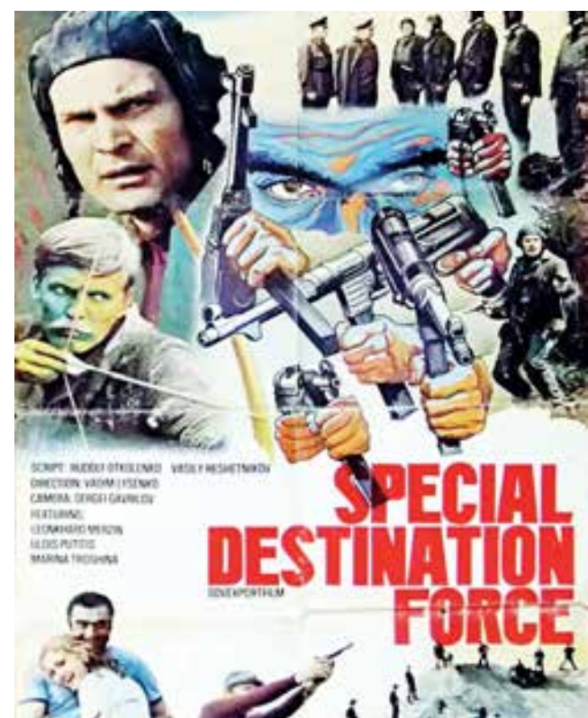
Афиша фильма «Отряд особого назначения» в зарубежном прокате