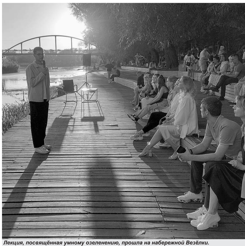
Лекция, посвящённая умному озеленению, прошла на набережной Везёлки.