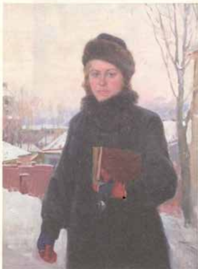
И. А. Тихий. Сельская учительница. 1950-е гг.