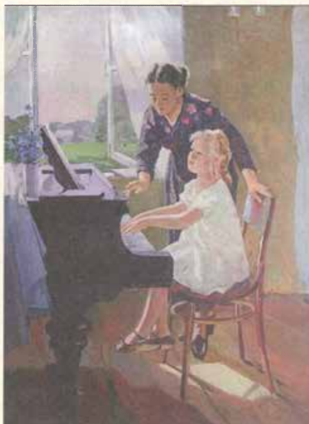
А. Л. Наседкин. Урок музыки. 1970 г.