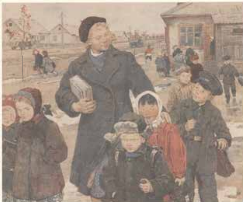
И. Н. Воробьева. Учительница. 1957 г.

Перед нами картины художников XIX–XX веков, посвящённые учителю – скромному, самоотверженному труженику просвещения.