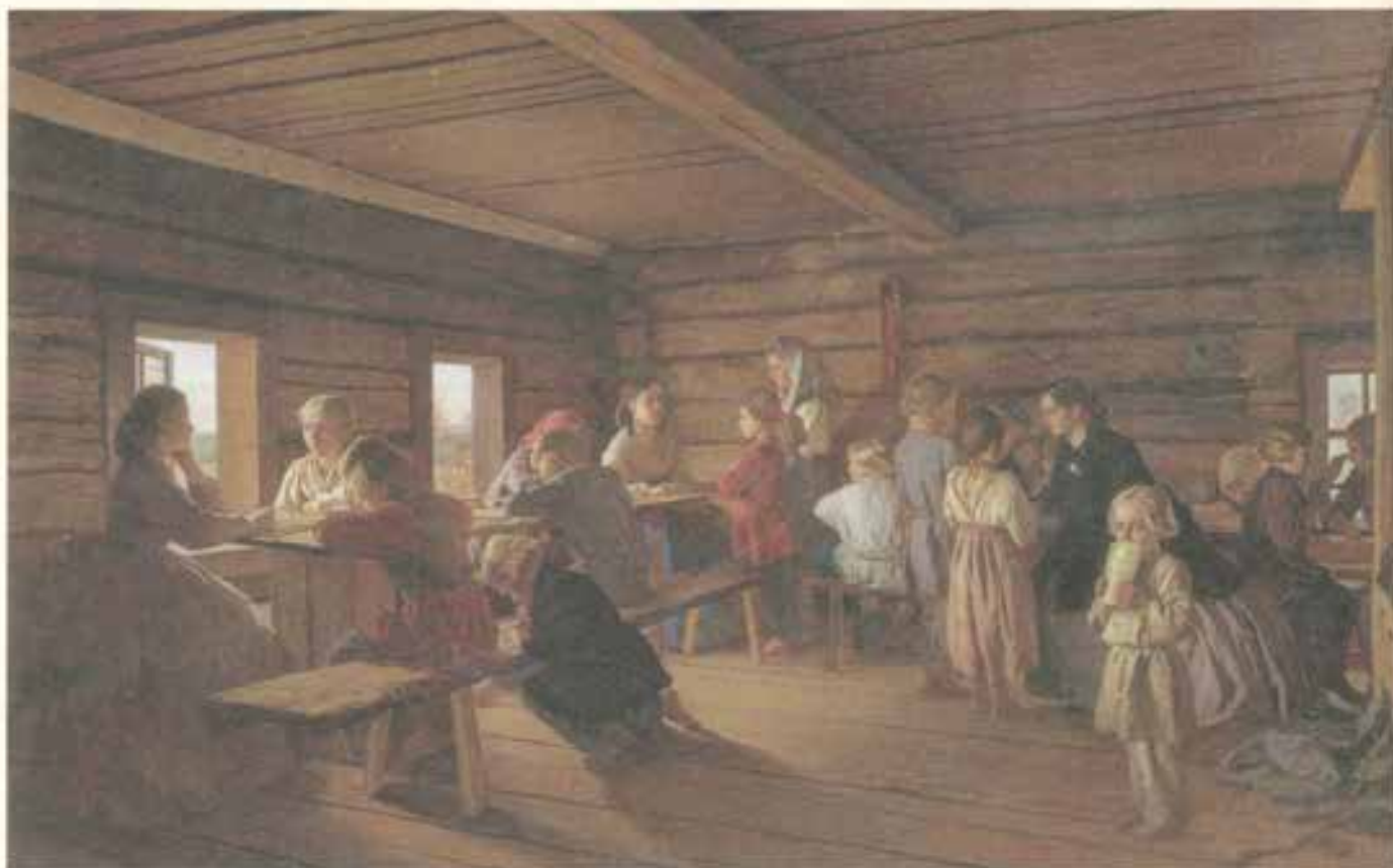
А. И. Морозов. Сельская бесплатная школа. 1865 г.