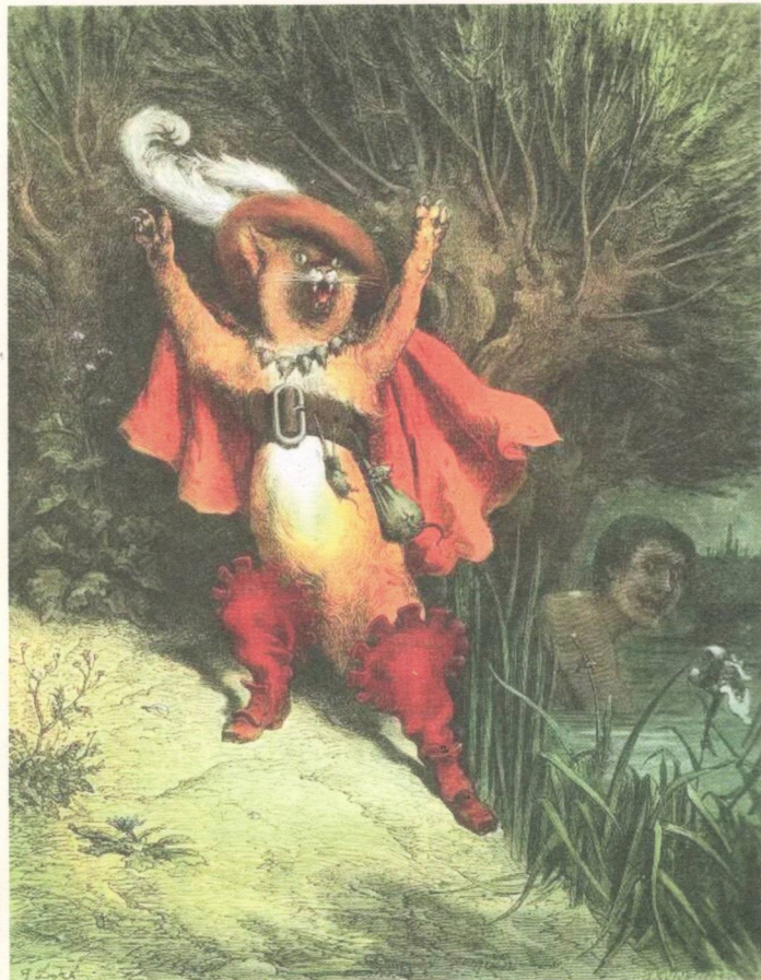
«Кот в сапогах»