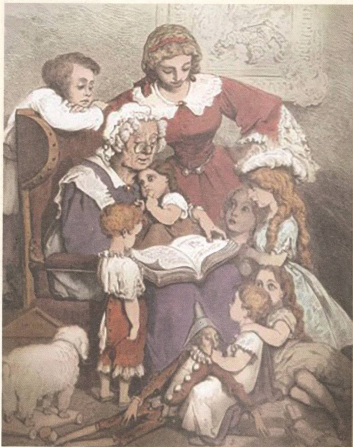
Авантитул к сказкам