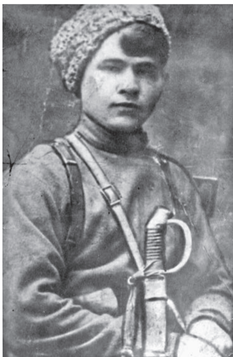
М.И. Демченко, организатор и первый командир 6-го Корочанского повстанческого полка. 1919 г.

дарственного историко-краеведческого музея. В экспозиции музея представлен раздел, посвященный Гражданской войне и немецко-гайдамацкой оккупации территории Белгородчины.