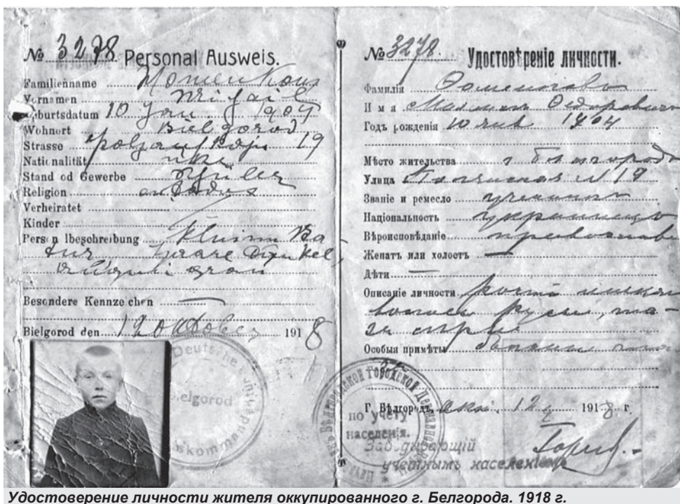
Удостоверение личности жителя оккупированного г. Белгорода. 1918 г.