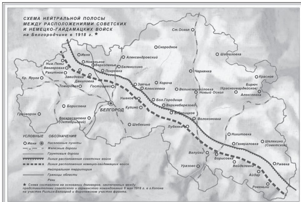
Схема нейтральной полосы между расположениями советских и немецко-гайдамацких войск на Белгородчине в 1918 г.

С ростом террора на оккупированной территории стало возрастать сопротивление со стороны мирного населения. Стихийно стали образовываться партизанские отряды, которые активно