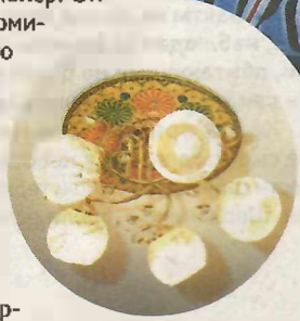
Николай Сергеевич вкладывает всю душу в свои работы