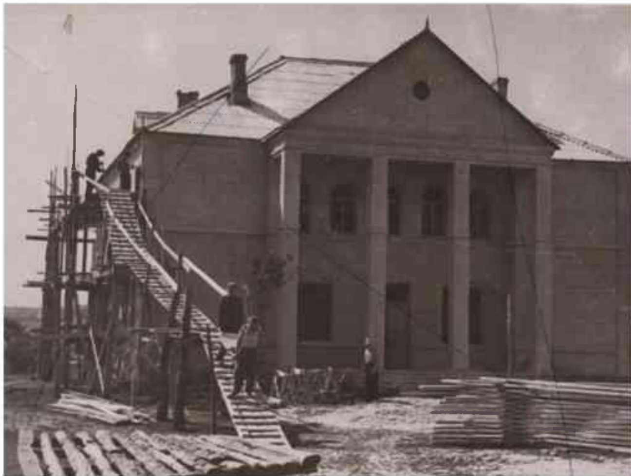
Строительство Дома культуры в колхозе имени Калинина Шебекинского района. 1950-е

«Городской комитет партии и исполком городского Совета депутатов трудящихся от имени общественных организаций, коллективов предприятий, организаций, учреждений и всех трудящихся города просят Белгородский промышленный обком КПСС – исполком областного Совета депутатов трудящихся войти в ходатайство перед Президиумом Верховного Совета РСФСР о переименовании города Шебекино в город Нежегольск», – говорится в письме в обком партии от исполкома Шебекинского городского Совета депутатов.