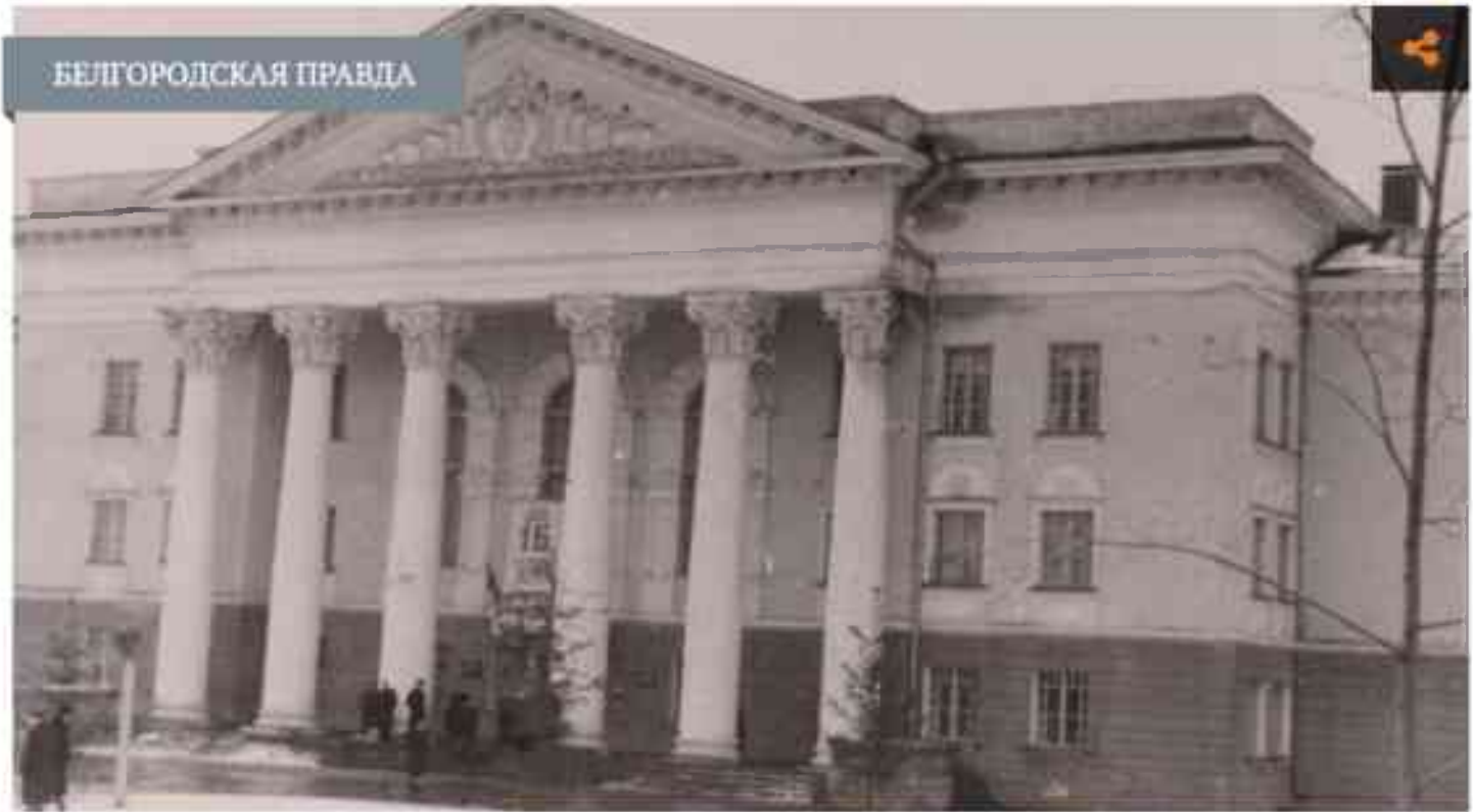
Дворец культуры в Шебекино, 1957 года постройки

А знаете ли вы, что города Алексеевка и Шебекино нашей родной Белгородской области могли бы носить другие названия? Лишь по счастливой случайности их не переименовали.