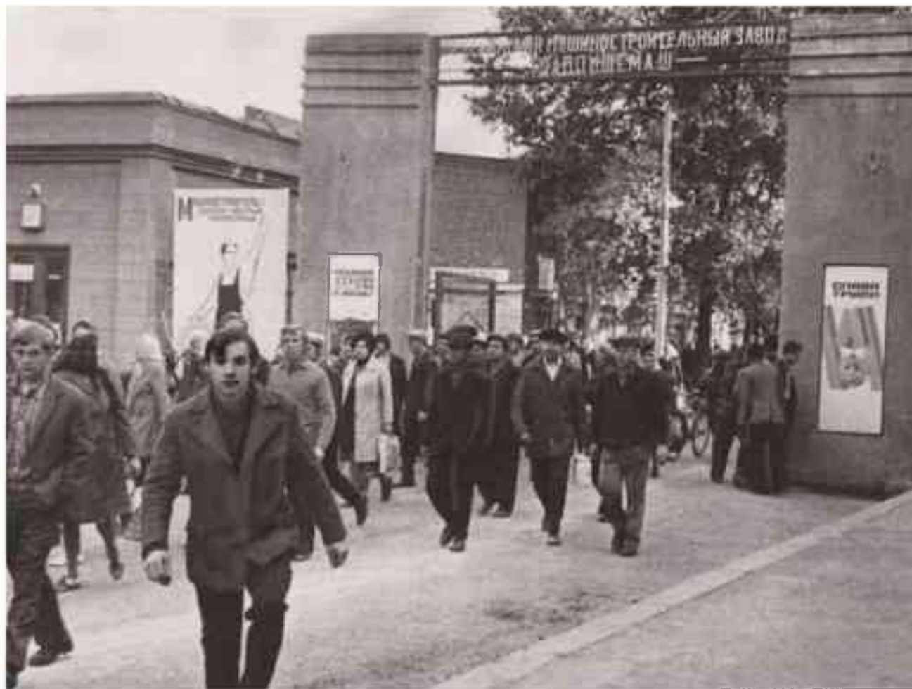
У проходной Шебекинского машиностроительного завода. 1970-е годы

«Алексеевский райком КПСС и исполкомы районного и городского Советов депутатов трудящихся, учитывая многочисленные просьбы трудящихся, просят рассмотреть и поставить перед Президиумом Верховного Совета РСФСР вопрос о переименовании Алексеевки в город Ольминский, соответственно Алексеевского района в Ольминский район», – говорится в документе, подписанном 12 мая 1965 года.