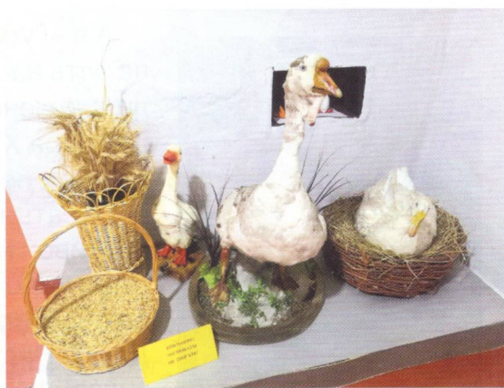
Холмогорская богородская – самая крупная порода гусей, известная на сегодняшний день

«Подкованные» гуси прекрасно доходили своим ходом не только до Москвы и Санкт-Петербурга, но и, по слухам, до самого Парижа!