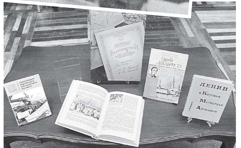
Несколько книг журналист создал в соавторстве с сыном

В 1773 году русский астроном Пётр Иноходцев впервые обратил внимание на странное поведение компаса в некоторых местах Курской губернии. Магнитная стрелка здесь упорно отклонялась от своего положения