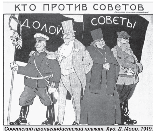
Советский пропагандистский плакат. Худ. Д. Моор. 1919.

Показательна система перевода учеников из одной ступени в следующую. Учащиеся, регулярно посещавшие занятия и получившие положительный отзыв от преподавателей, переводились на следующую ступень образования автоматически без сдачи зачётов и