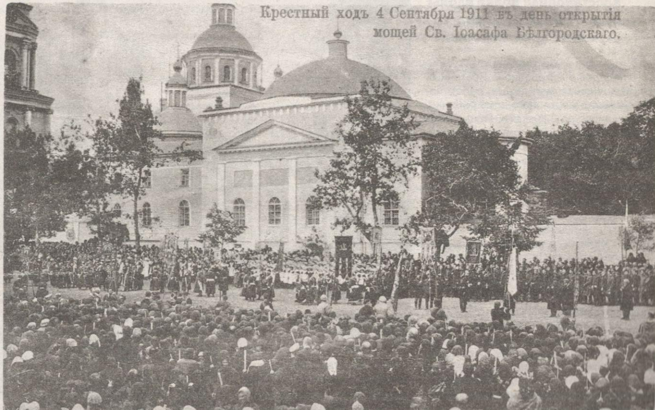
Крестный ход в день открытия мощей святителя Иоасафа Белгородского, г. Белгород. 1911 г.