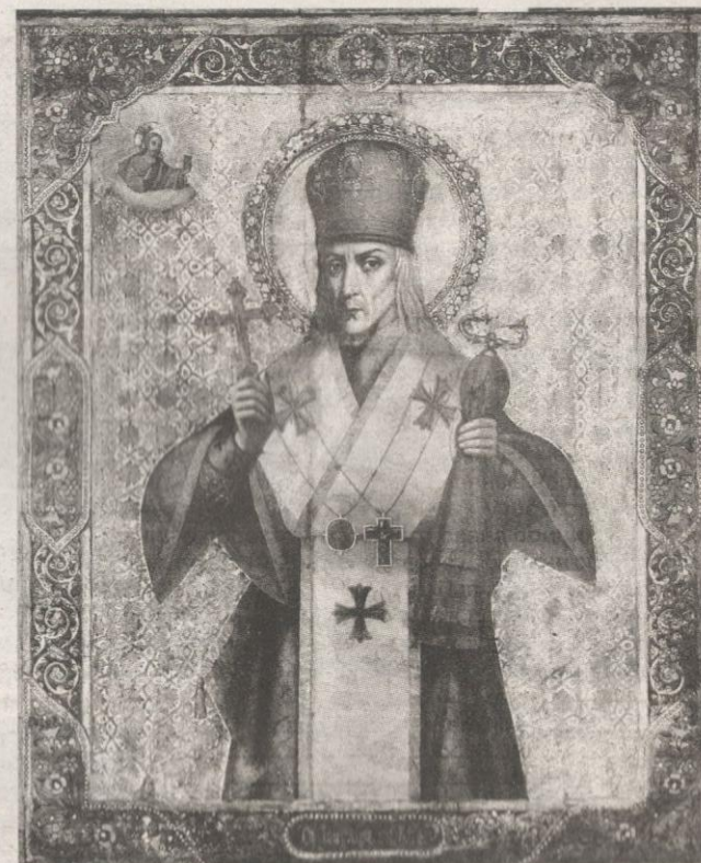
Икона «Святитель Иоасаф Белгородский». Нач. XX в.

Великая княгиня Елизавета Фёдоровна особо почитала святителя Иоасафа Белгородского. Уже будучи настоятельницей московской Марфо-Мариинской обители милосердия, она в сопровождении сестёр вместе с ве-